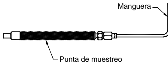
Figura 1. Ejemplo de sonda de muestreo.

3.24 Sonda de muestreo. Es el elemento que se introduce al acople o hace parte del acople con el objeto de tomar una muestra de los gases de escape del mismo. La sonda de muestreo está compuesta por la punta de muestreo de gases y la manguera (véase la Figura 1).